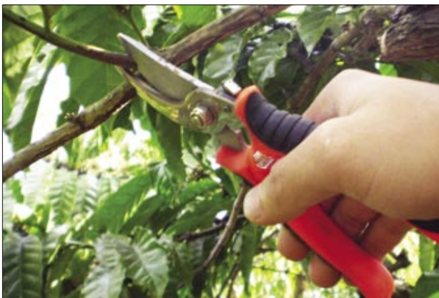
A zöldmetszésnél nagyobb a fertőzésveszély, mint ha lombhullás után metszünk

Az adott gallyon és vesszőn figyeljük meg, hogy mennyi virágrügy van. Ha túl